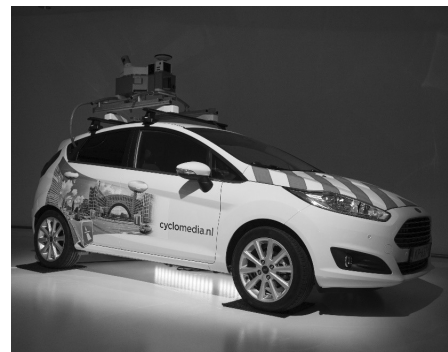
Moderne Technik auf dem Dach – Das Aufnahmefahrzeug der CycloMedia.

sind für die Zeit vom 22. Oktober bis voraussichtlich 16. November geplant. Als Mitglied im Verein „Selbstregulierung der Informationswirtschaft“ (SRIW) unterliegt die Firma CycloMedia dem Datenschutzkodex für Geoinformationsdienste. Aus datenschutzrechtlichen Gründen werden daher Gesichter und Kfz-Kennzeichen unkenntlich gemacht. Die Nutzung der Bilddaten dient ausschließlich internen Zwecken, sodass eine Veröffentlichung der Panoramadaten nicht erfolgt. Im Vorfeld wurden sowohl die Kommunen als auch die entsprechenden Ordnungsämter über die Fahrten informiert.